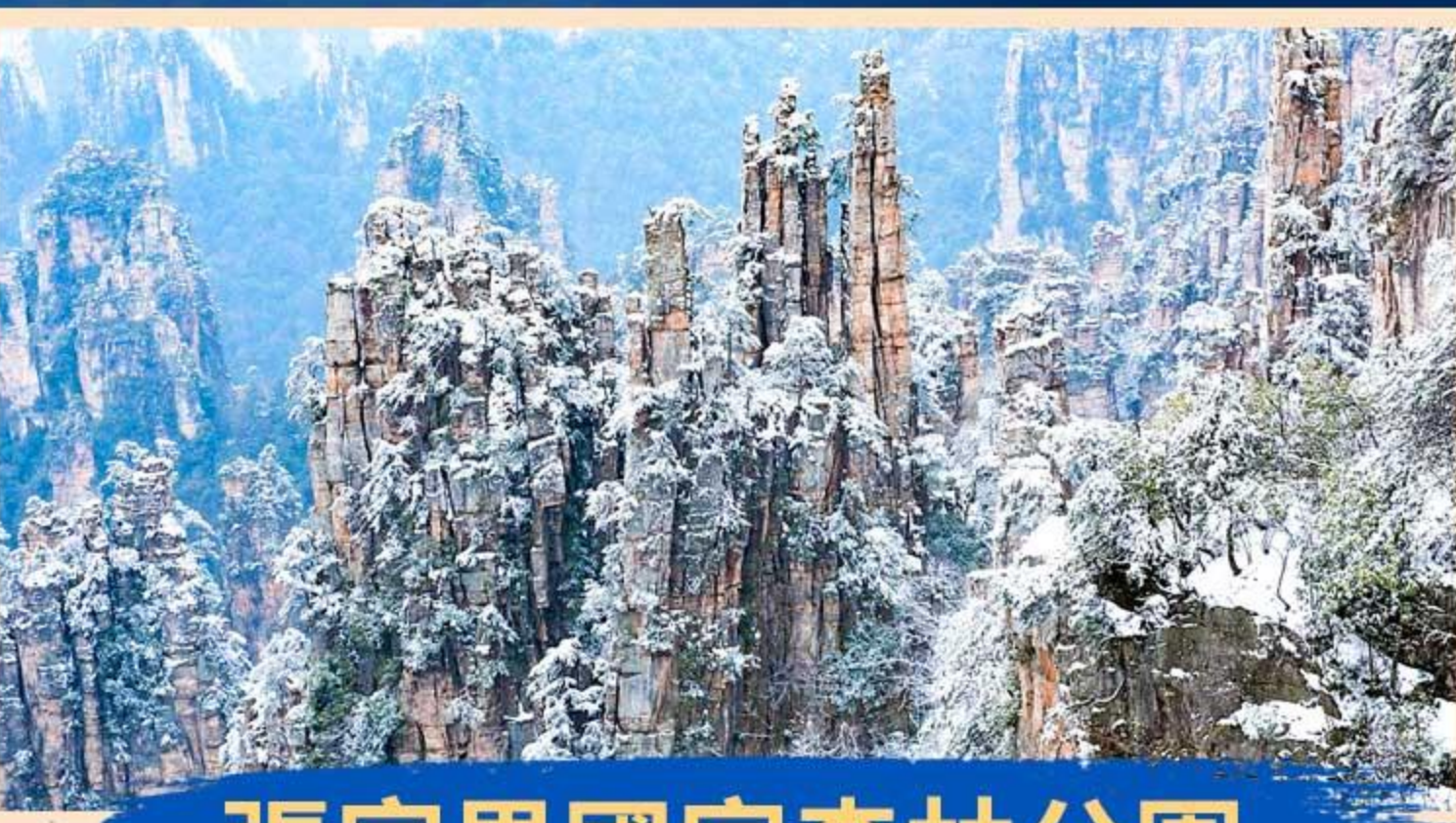
張家界國家森林公園