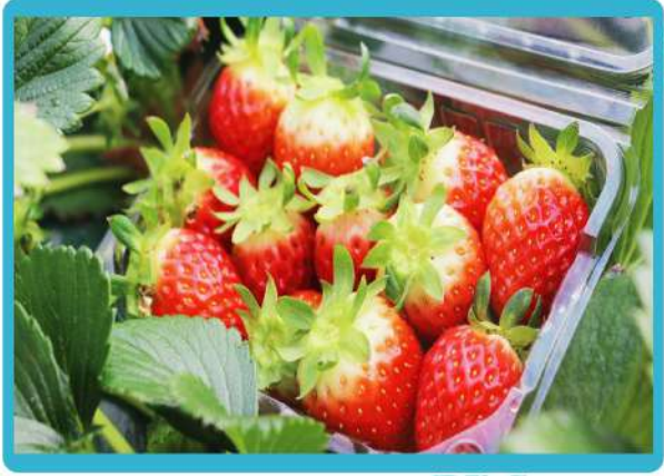
士多啤梨果園採摘體驗