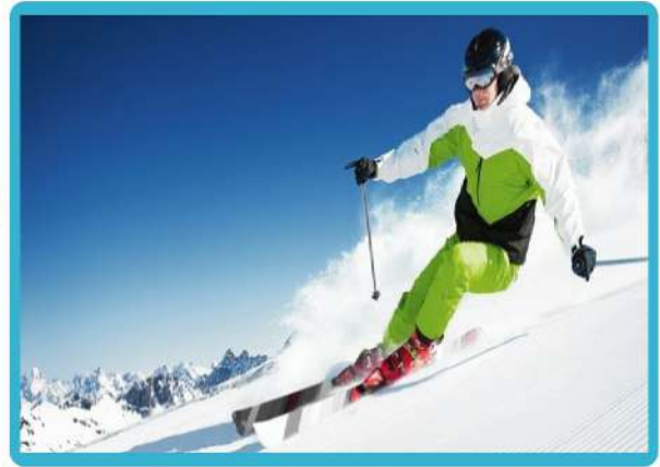
滑雪體驗 · 包滑雪用具