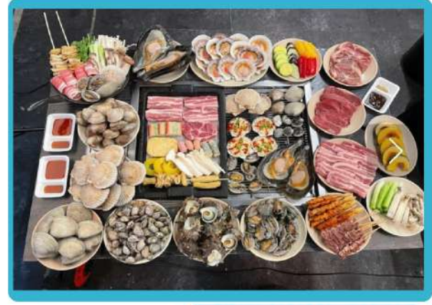
即撈即夾活捉嘍燒海鮮